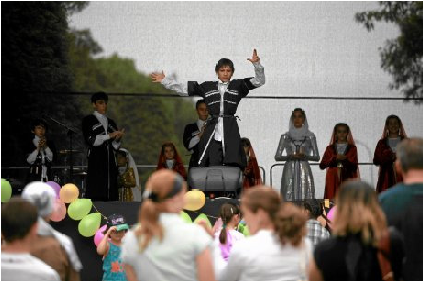
Dzień Uchodźcy, dziecięcy zespół czecheński Lowzar

Warsztaty przygotowujące do spotkania z przedstawicielami innych kultur rozpoczęła w białostockich szkołach Fundacja Obywatelska Perspektywa. Z imigrantami oraz uchodźcami mamy dziś styczność na co dzień, warto więc dowiedzieć się o nich więcej.